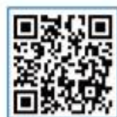
複賽/準決賽報名表